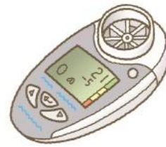
ハイ・チェッカー

誰でも簡単にFEV1などの主要項目や 肺年齢を測定できます。 実測値に加え、標準値に対する%を表示します。